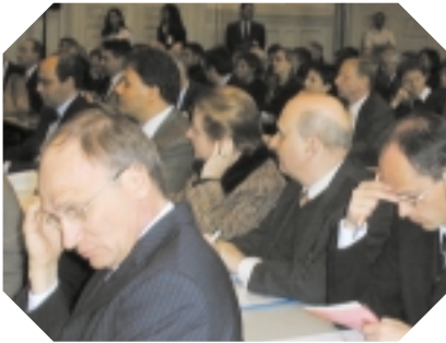
Sala del Convegno